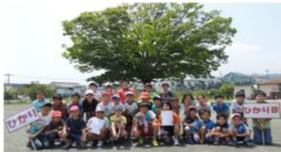
優勝ひかりB・準優勝ひかりAチーム

決勝戦はひかり子ども会同士(ひかりA対B)の対戦となり、激戦の結果、決勝同点のため、勝敗はジャンケンでひかりBが優勝。