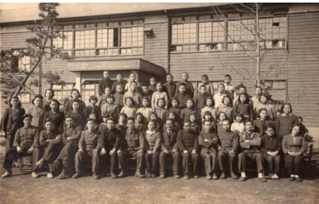
昭和23年3月卒業6年3組 現在79歳 前列に郷土研究に携った先生方