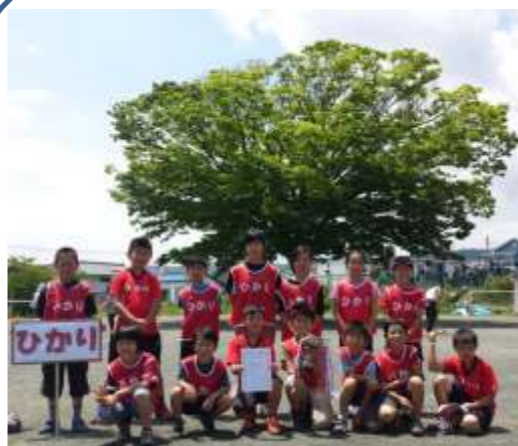
優勝 ひかり子ども会 (ミラクル)

6月7日(日)に子ども会球技大会が開催されました。前日の雨が嘘のような晴天に恵まれ、6単会から7チームによる激戦が繰り広げられました。結果は、ひかり子ども会(ミラクル)が見事優勝しました。準優勝はよつ葉子ども会3位は日の出東町子ども会となりました。