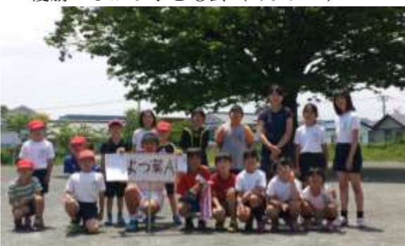
準優勝よつ葉子ども会