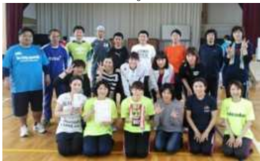
優勝は9連覇 よつ葉子ども会