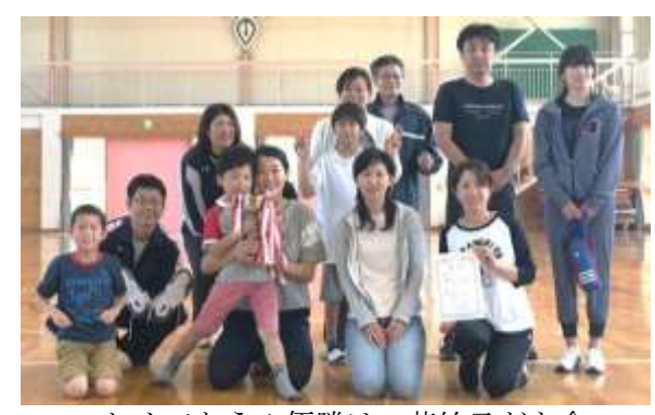
おめでとう! 優勝は 若竹子子ども会

育成会親睦会ソフトバレー大会 5月14日(土)、会瀬小体育館にて会瀬学区子ども会育成会親睦ソフトバレーボール大会が行われ、子ども会育成会と先生チームの計6チームが出場しました。 優勝「若竹子子ども会」 準優勝 「潮音子ども会」 第三位「よつ葉子ども会と先生チーム」でした。 今大会10連覇のかかったよつ葉子ども会は残念ながら準決勝で惜敗しましたが、みな注目を集める中、力強いプレーで会場を大いに沸かせました。 育成会より提供したとん汁や各子ども会が準備したお昼を食べ、交流を深めることが出来ました。 最後に、会瀬ママさんバレーの皆さま、審判等のご協力、大変ありがとうございました。