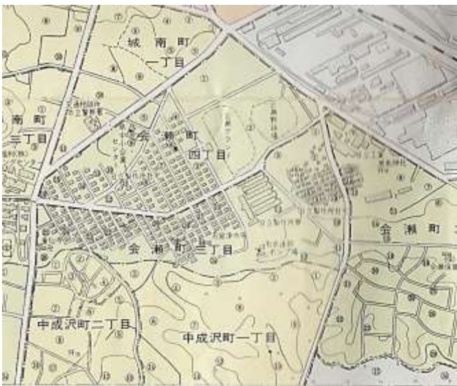
昭和40年代の会瀬社宅地図

身分の違いがあったのである。当然、役宅と社宅では敷地の広さや間取りに違いがあった。同じ役宅でも昭和16年に建設された兎平に近い地所の役宅と、現在の鹿島神社裏参道から西側の地に、戦局が悪化した昭和19年に建設された小山役宅では大きな差があった。昭和20年の爆弾攻撃・艦砲射撃・焼夷弾攻撃に際しても会瀬3・4丁目の社宅や寮の多くは被災しなかった。以後、近年まで市街の形態は大きく変化することなく推移し、参考市街図のような市街地を形成していた。現在、古い社宅が取り払われ現代風の宅地造成が進み、新しい市街地が出現しつつあるこの地の、昔日の姿をしのぶよすがとして記録した。