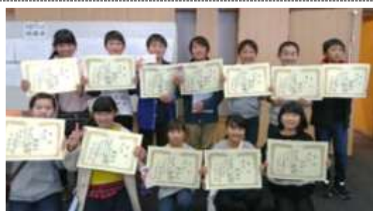
・5位 KMI・9位 会瀬B型トリオ ・11位 R2-D2・13位 さくらんぼ

1月22日(日)多賀市民プラザにおいて、日立市青少年育成推進会議と日立市内5ロータリークラブ主催で開催されました。「ひたち郷土かるた」は、日立市の風土や歴史などを盛り込んで作成されました。遊びながらふるさとを学べるのが「ひたち郷土かるた」です。72チームが参加17位までが表彰ができました。会瀬学区から7チームが参加し4チームが受賞しました。