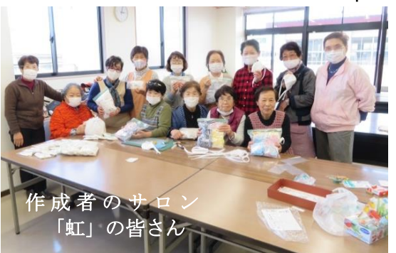
作成者のサロン 「虹」の皆さん